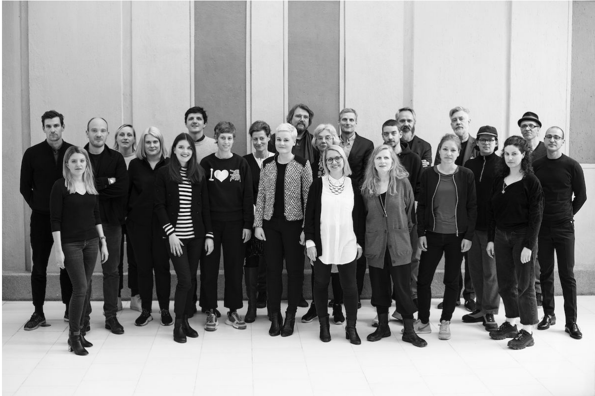
Vertreterinnen und Vertreter des Kooperationsprojekts „VARIOUS OTHERS“

Galerien, Off-Spaces und Museen haben sich zusammengeschlossen, um Projekte auf internationalem Niveau auf die Beine zu stellen. All das alles läuft unter dem Namen VARIOUS OTHERS .