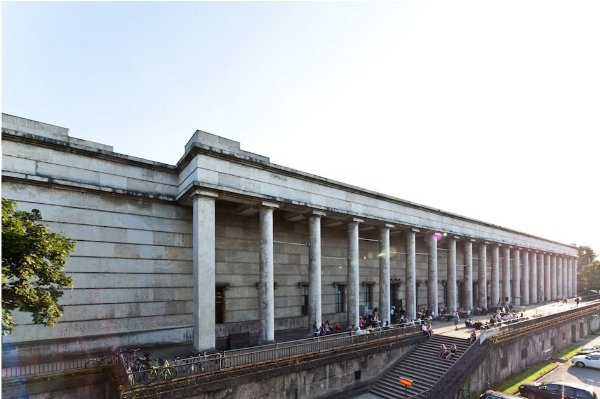
Die 99. KUNST&ANTIQUITÄTEN MÜNCHEN findet im Westflügel des Haus der Kunst statt. Haus der Kunst, 2012.

Die 99. KUNST&ANTIQUITÄTEN München wird vom 12. bis 20. Oktober 2019 erstmals im Westflügel des Haus der Kunst stattfinden. Ein langer Traum erfüllt sich damit für die Messe-Organisatoren und Ausstellerinnen und Aussteller der ältesten Kunst- und Antiquitätenmesse Süddeutschlands .