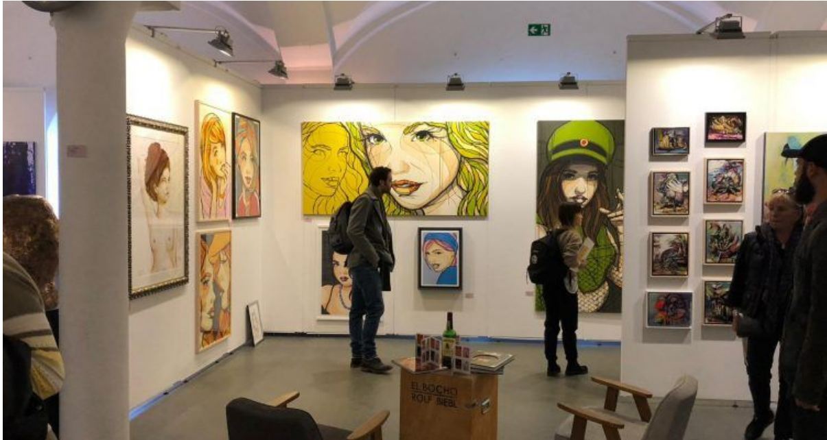
Street Art, Fotografie oder digitale Kunst gibt es auf der ARTMUC zu sehen.

Vom 17. bis 20. Oktober 2019 stellen auf der ARTMUC wieder rund 100 junge Künstlerinnen und Künstler aus ganz Europa ihre Werke aus. Als Ausstellungskulisse dienen das Isarforum und die stilvolle Praterinsel .